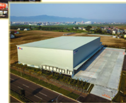
共通運送 株式会社 札幌市東区