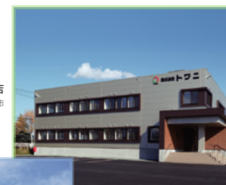
トワニ北見店 北見市