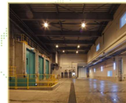
岩見沢中間処理施設 岩見沢市