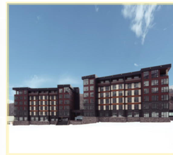
Yu Kiroro 赤井川村