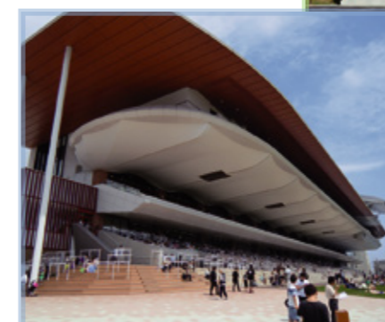
函館競馬場 函館市