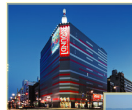
札幌東宝公衆ビル 札幌市中央区